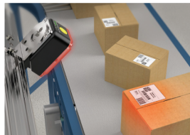
Системы распознавания QR кодов, этикеток, штрих-кодов, инвентарных номеров, бирок, товарных знаков, и т.д.