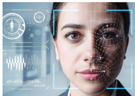
Системы безопасности и СКУД