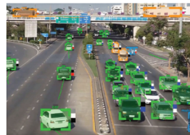
Системы автоматизации в сфере логистики транспорта, производственных циклов